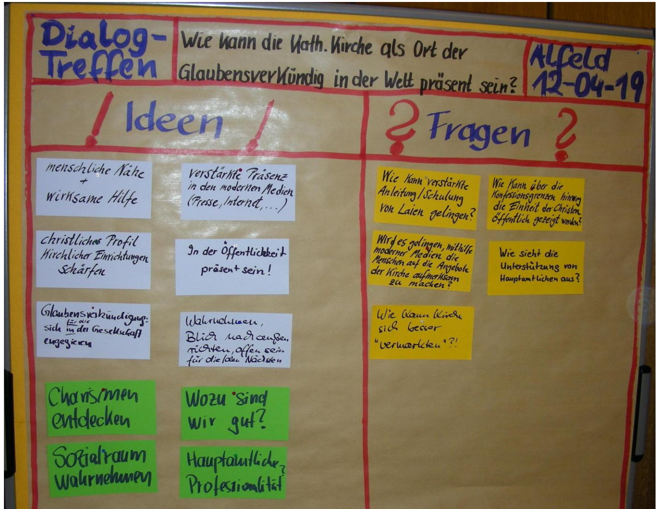
Grüne Karten: Ergänzungen während des Plenums-Gesprächs

Ergebnisse der Gesprächsgruppen zur zweiten zentralen Frage: „ Wie kann die katholische Kirche mit ihren Gemeinden und Einrichtungen als Ort der Glaubensverkündigung in einer säkularen Gesellschaft präsent sein? “